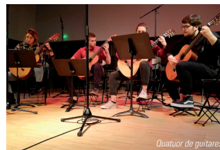
Quatuor de guitares